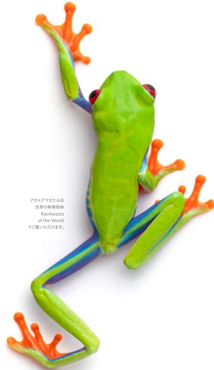
アカメアマガエルは世界の熱帯雨林 Rainforests of the World でご覧いただけます。